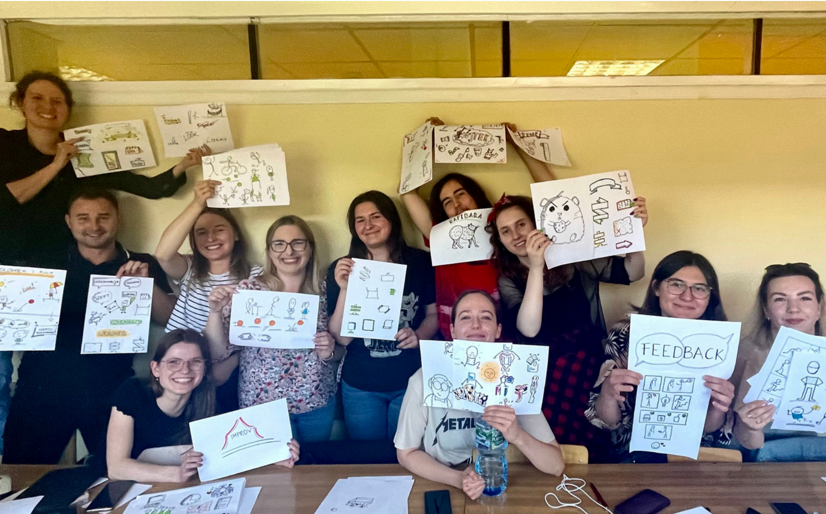
WARSZTATY Z MYŚLENIA WIZUALNEGO 2023