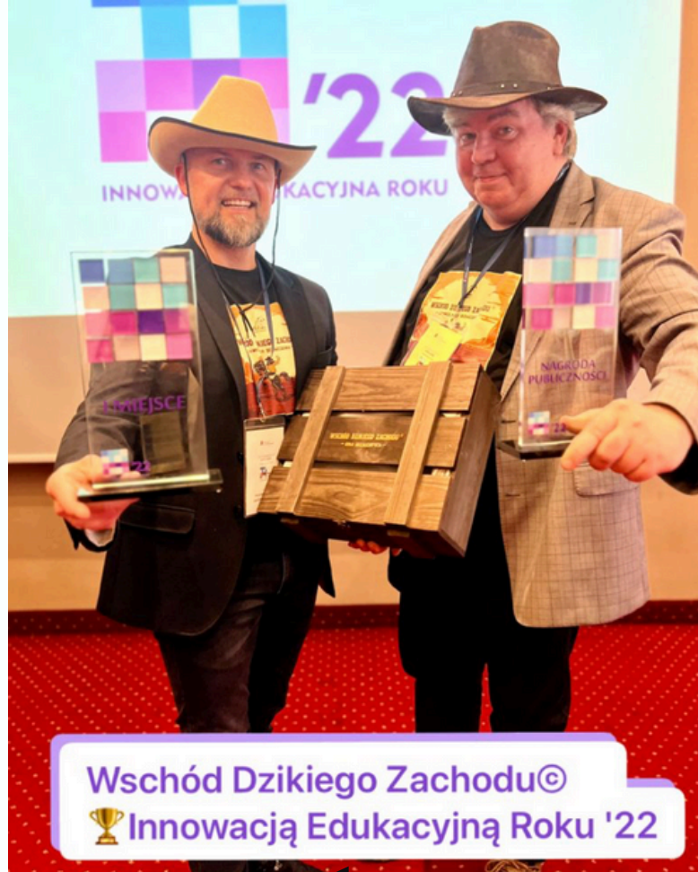
Wschód Dzikiego Zachodu© Innowacją Edukacyjną Roku '22