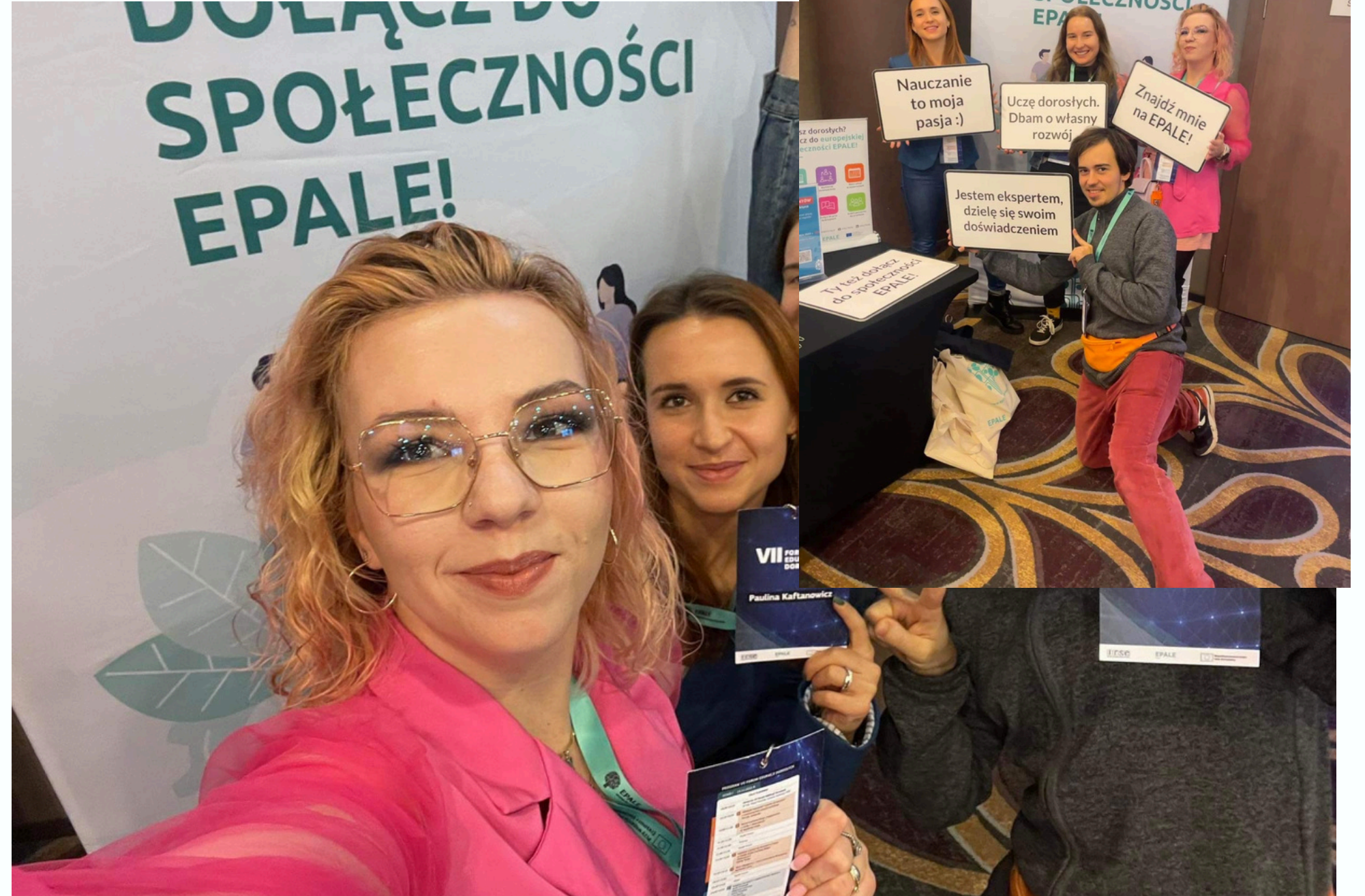
VII FORUM EDUKACJI DOROSŁYCH EPALe