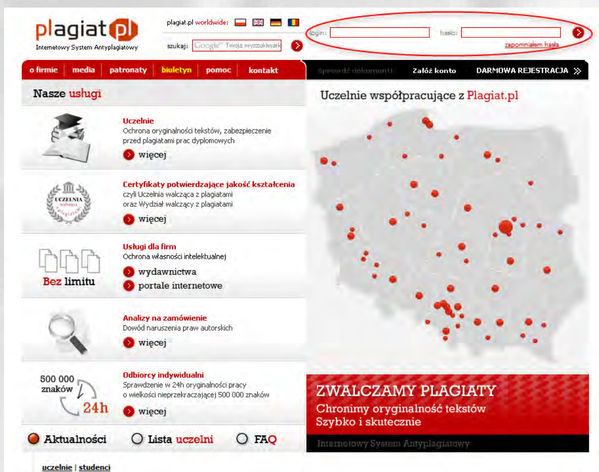
Ilustracja 1. Strona główna serwisu Plagiat.pl - logowanie do Systemu