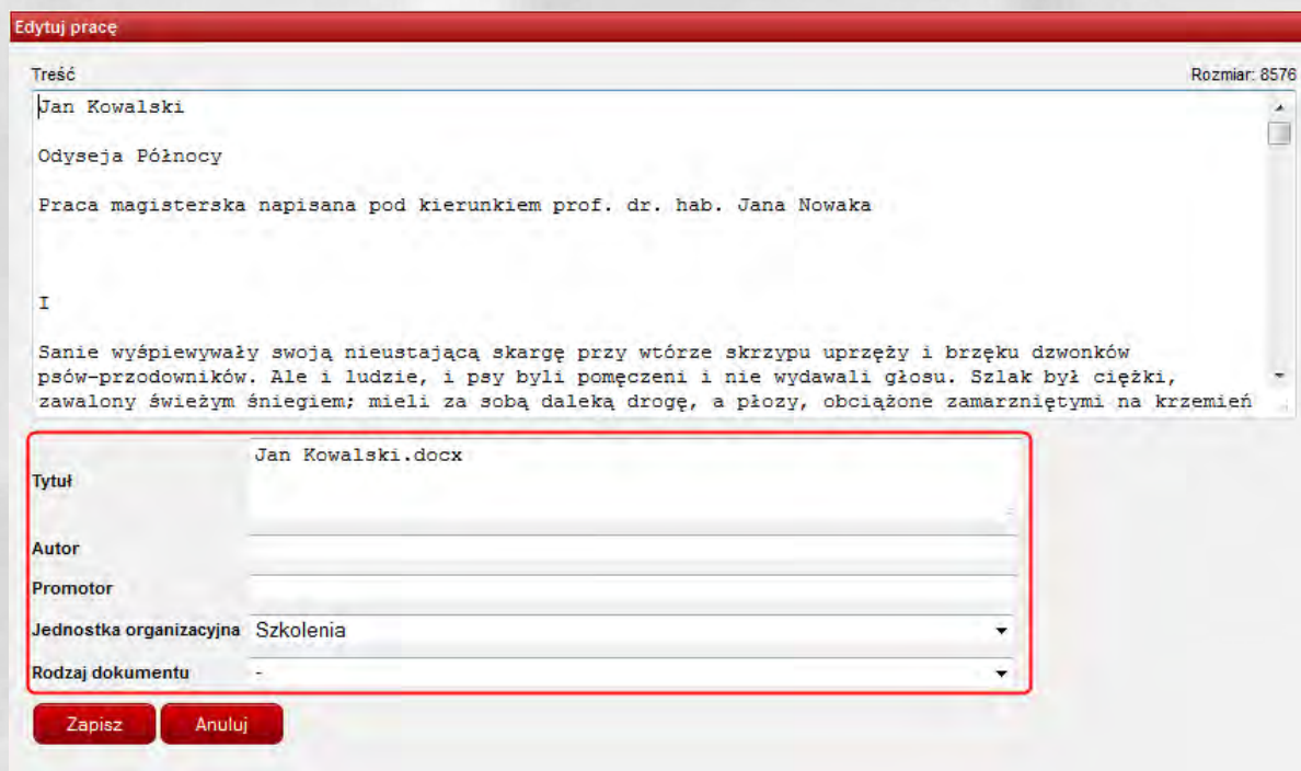
Ilustracja 4. Okno edycji pracy.

W przypadku wyboru metody kopiuj/wklej należy zaznaczyć treść całego dokumentu (poprzez kombinację klawiszy Ctrl+A), następnie skopiować zaznaczenie (za pomocą kombinacji klawiszy Ctrl+C) i wkleić je do rubryki „Treść” (kombinacja klawiszy Ctrl+V).